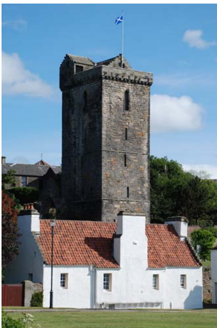
Fler bilder från Dysart, Anstruther, Crail och Culross

St Andrews är inte bara golfens vaggas och Mekka, här finns också en borgruin, och intressantare, en klosterruin med många spännande gravar.