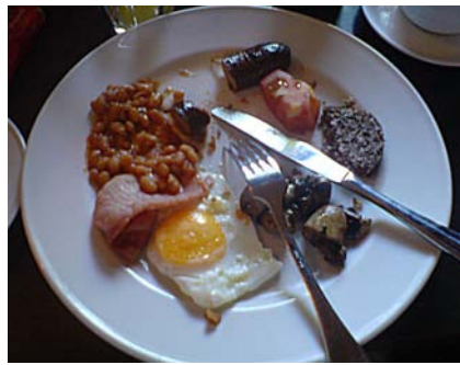
Skotsk frukost - missa inte haggisen, den smakar som isterband