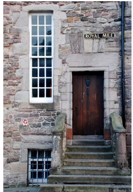
På kvällen gjorde vi en rundtur i Edinburgh medan solen gick ner. Bilderna är från Old Town .