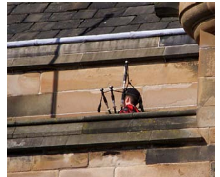
Säckpipa på slottet