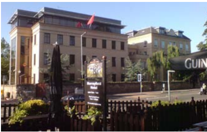
Hotellet låg vid Murrayfield Stadium, med kinesiska konsulatet tvärs över gatan