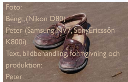
Text, bildbehandling, formgivning och produktion: Peter